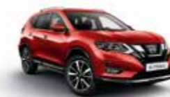
ROJO TITANIO (METÁLICO)