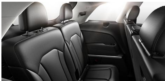
Tercera corrida de asientos eléctricos