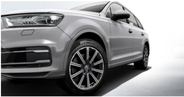
Llantas de aleación de aluminio tamaño 9Jx20, diseño estrella de 10 radios, con neumáticos 285/45