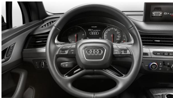
Volante multifunción en cuero, diseño 4 radios y levas de cambio