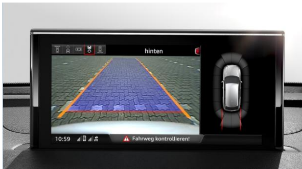
Sistema de aparcamiento plus delantero y trasero con cámara trasera