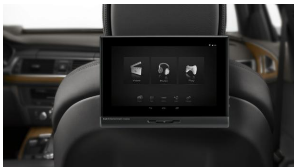
Preparación para sistema de entretenimiento trasero (Venta de pantallas plug-in a través de Accesorios Audi)