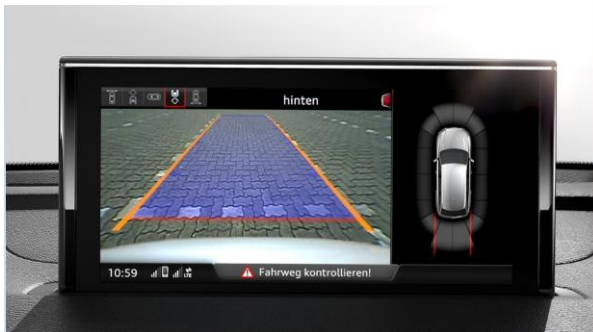
Sistema de aparcamiento plus delantero y trasero con cámara trasera