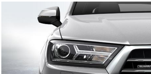
Luces de Xenón incl. luz LED de circulación diurna