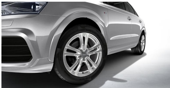
Llantas de aleación de aluminio 18", diseño de brazos en paralelo, tamaño 7J x 18, con neumáticos 235/50 R18