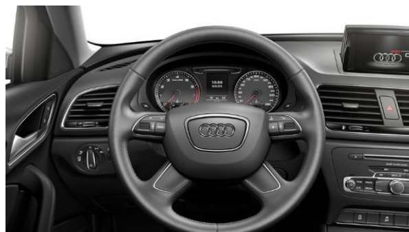
Volante multifunción de 4 puntas, tapizado en cuero