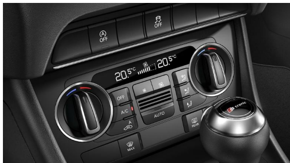
Climatizador automático confort de dos zonas