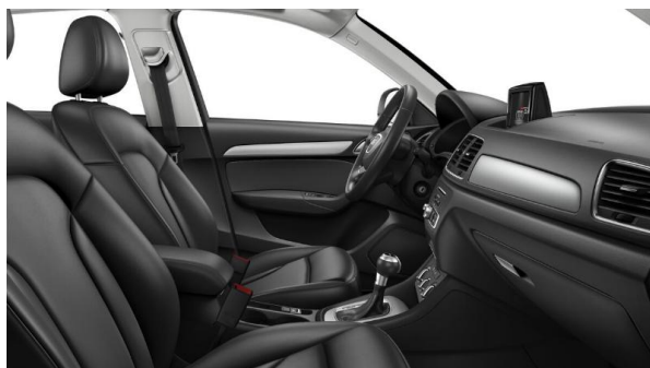
Asientos delanteros deportivos con apoyo lumbar eléctrico y tapizados en Alcantara/Cuero. Inserciones en negro brillante