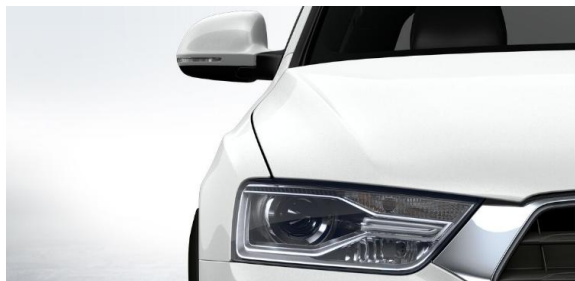
Luces principales Xenón plus

*Datos entregados por el 3CV. El rendimiento efectivamente obtenido por cada conductor dependerá de sus hábitos de conducción, de la frecuencia de mantenimiento del vehículo, de las condiciones ambientales y geográficas, entre otras.