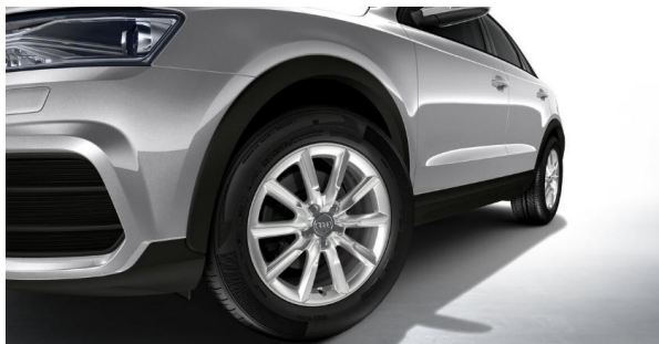
Llantas de aleación de aluminio 17", diseño 10 brazos, tamaño 7J x 17, con neumáticos 235/55 R17