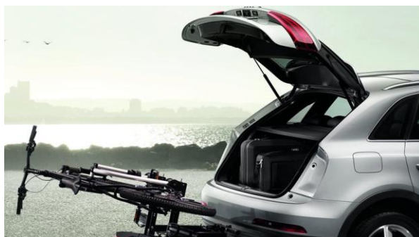
Maletero con apertura y cierre eléctrico