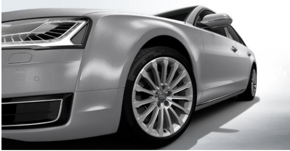
Llantas de aleación de aluminio fundido, de 15 rayos, tamaño 9J x 19 con neumático 225/45 R 19