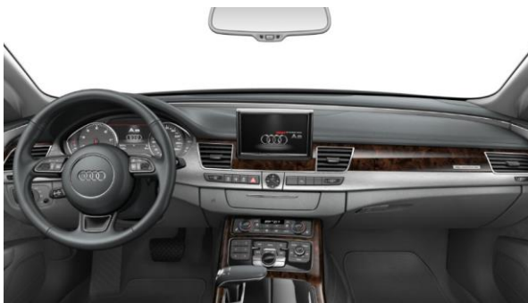
Insertos inferiores en aluminio cepillado color plata y superiores en madera de raíz de nogal