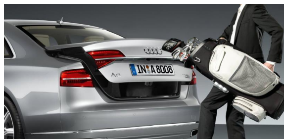
Comfort key con desbloqueo del maletero por control gestual