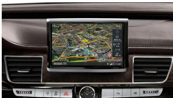
Sistema de navegación